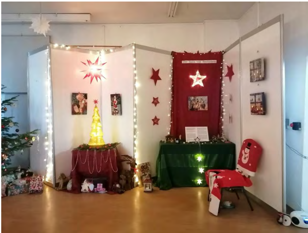
Danke, liebe Annett, für diese schöne Weihnachtsausstellung!